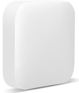
Modelshot | Funktaster Mini 1-K